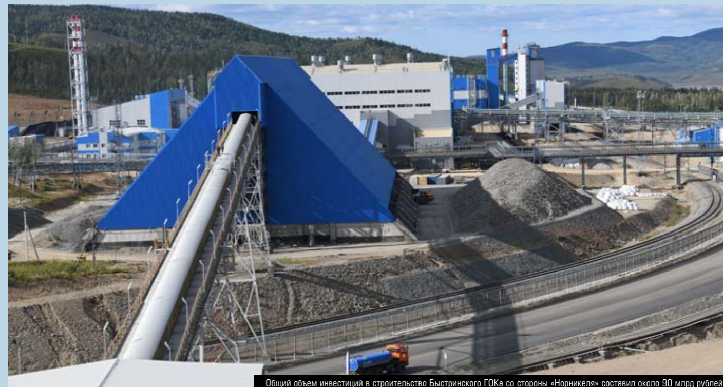
Общий объем инвестиций в строительство Быстринского ГОКа со стороны «Норникеля» составил около 90 млрд рублей

Один из крупнейших за последнее время гринфилд-проектов в горнорудной отрасли готовится к выходу на проектную мощность